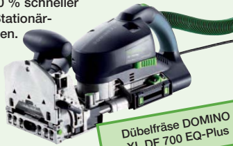
Dübelfräse DOMINO XL DF 700 EQ-Plus

Bis zu 50 % schneller als mit Stationärmaschinen.