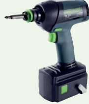
Akku-Schlagschrauber TI 15 IMPACT Basic

Einzigartig: Schlag-, Bohr- und Winkelschrauber in einem!